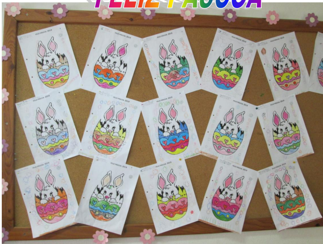
Beijinhos dos "ALEGRETES"